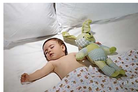
D'où vient-elle ? Découvrez l'origine de cette légende qui a bercé votre enfance (Camilia)