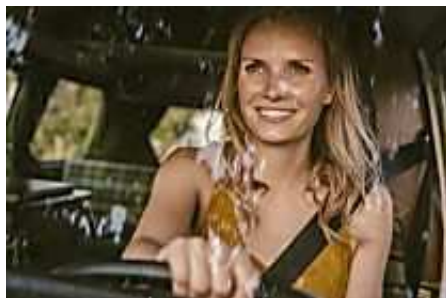
Vous roulez moins de 8000 km/an ? AXA a une très bonne nouvelle! (AXA)