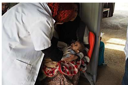
Irak, l'impact de la guerre. (MSF)