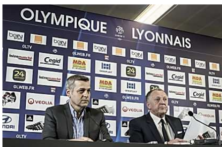
Mercato : Aulas confirme Génésio pour la saison prochaine (RTL)