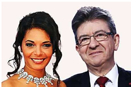
Que font les conjoints des politiques dans la vie?